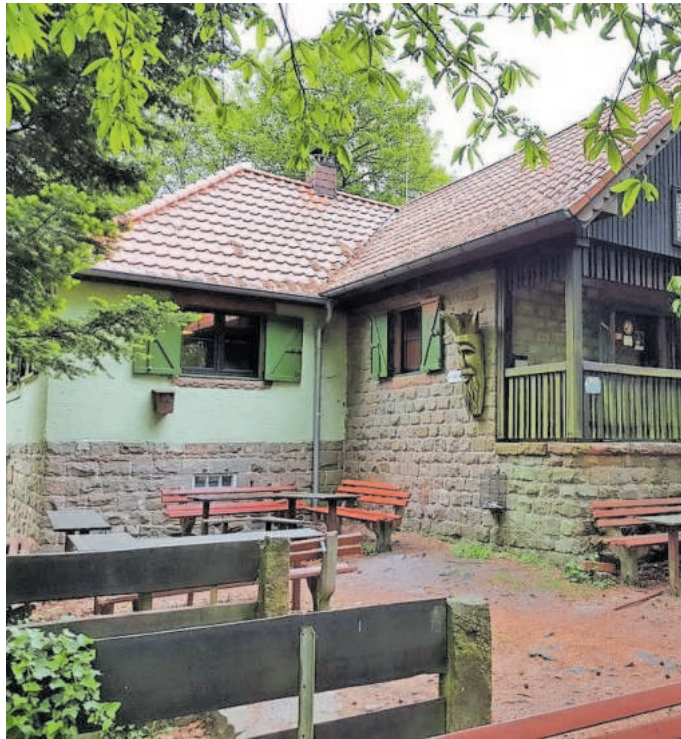
Ringelsberghütte bei Frankweiler

Diese provisorisch durchgeführte Maßnahme soll weitergeführt werden. Die Wasserversorgung erfolgt über eine Hochdruckpumpe, die 130 Meter Höhendifferenz leisten muss. Pumpe, Druckbehälter, Elektro- und