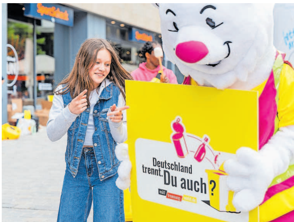
Der Trenn-Bär zeigt, wie richtige Abfalltrennung funktioniert